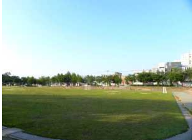
봉동 둔산공원 드라이브인 페스타 (전북 완주군 봉동읍 둔산3로 94) (무대 앞 피크닉존 / VIP존 형성 예정)