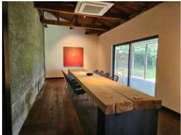
삼례문화예술촌 카페 삼례로 (전북특별자치도 완주군 삼례읍 삼례역로 81-13)