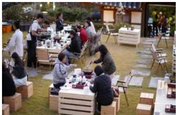
소양 별빛주막 행사장 내 소양고택 (전북특별자치도 완주군 소양면 대흥리 371)