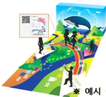
※ 예시 이미지